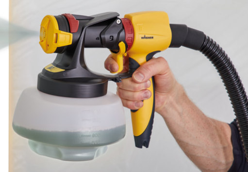
1800 ml Aufsatz für Wandfarbe