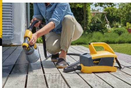
Lackieren Sie ihre Terrasse neu!

Sie möchten Ihre Wände und Decken gerne mit Farbe auffrischen oder farbig neu gestalten? Sie möchten Ihre Türen, Möbel in Haus und Garten oder Ihren Zaun lackieren? Verwirklichen Sie Ihre Ideen rund ums Thema Farbe sprühen ganz nach Ihrem persönlichen Geschmack. Sie haben Spaß dabei, wollen aber auch ein perfektes Ergebnis? Dann liegen Sie mit Produkten von WAGNER immer richtig. Also sprüh's doch einfach!