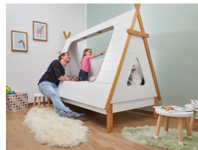
Gestalten Sie Wände in tollen Farben!