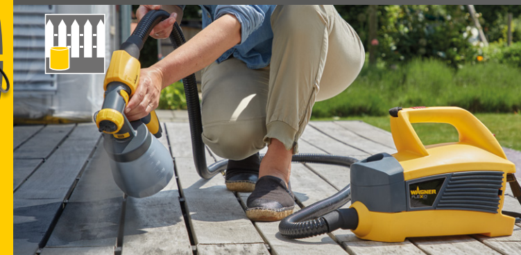
800 ml Aufsatz für Lacke und Lasuren

Variable Luftmengenregulierung - für die ideale Verarbeitung von unterschiedlich viskosen Materialien